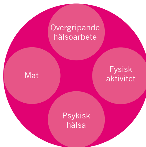
Skolhälsonyckeln – ett verktyg för självbedömning inom fyra moduler: "Övergripande hälsoarbete", "fysisk aktivitet", "psykisk hälsa" och "mat".

En årlig genomgång av frågorna i Skolhälsonyckeln gör det lätt att se hur hälsoarbetet utvecklas. Poängsättningen ökar i takt med att nya, mer hälsoinriktade rutiner införs.