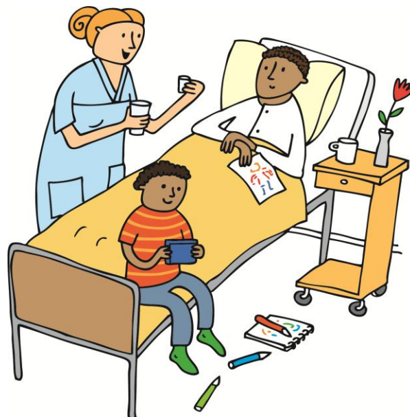
ILLUSTRATION: LOTTA GLAVE

”Barn som får åldersadekvat och mognadsanpassad kunskap om patientens sjukdom, skada, funktionsnedsättning eller dödsorsak har lättare att hantera och förhålla sig till sina egna och andras reaktioner samt de konsekvenser som uppstår i familjen eller i närmiljön.”