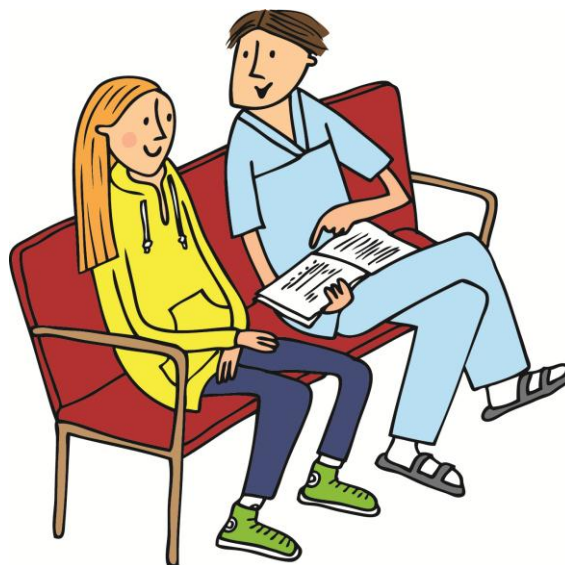
ILLUSTRATION: LOTTA GLAVE

”Barns förmåga att förstå utvecklas med hjärnans mognad och den kognitiva, språkliga och kommunikativa utvecklingen varierar stort mellan olika åldrar och mellan barn.”