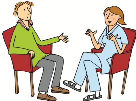
ILLUSTRATION: LOTTA GLAVE

Hur kan vi motivera patienter att prata med sina barn om sin situation?