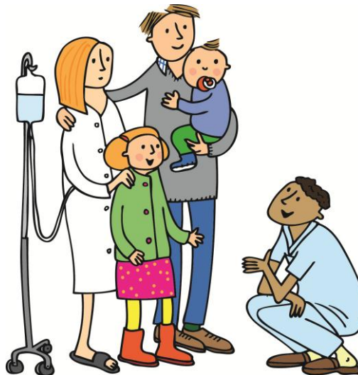
ILLUSTRATION: LOTTA GLAVE

”Varje barn är en unik individ och har sitt eget sätt att reagera, uttrycka känslor och förhålla sig till situationen och omgivningen. Samtalet ska ske på barnets premisser...”